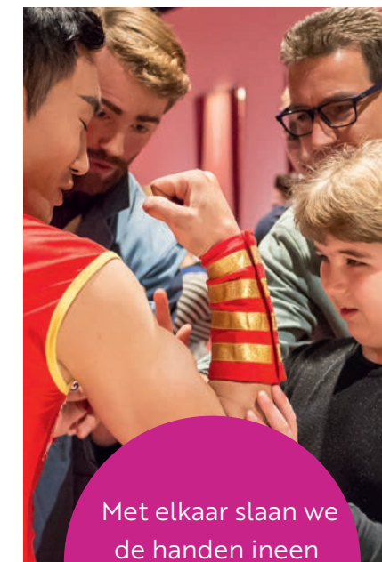
Komt het Zien!

Met elkaar slaan we de handen ineen voor een inclusieve recreatiemarkt.